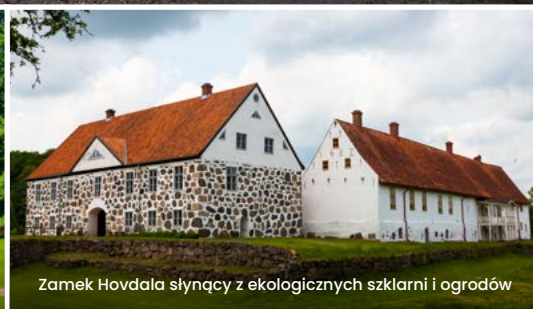
Zamek Hovdala słynący z ekologicznych szklarni i ogrodów

Elegancja, bogactwo i niezaprzeczalny urok to krótka charakterystyka zamków, pałaców i rezydencji, w które obfituje Skania. Poczuj magię życia w królewskiej rezydencji. Ale bez obaw, w Skanii za taką wizytę nie zapłacisz bajońskiej sumy.