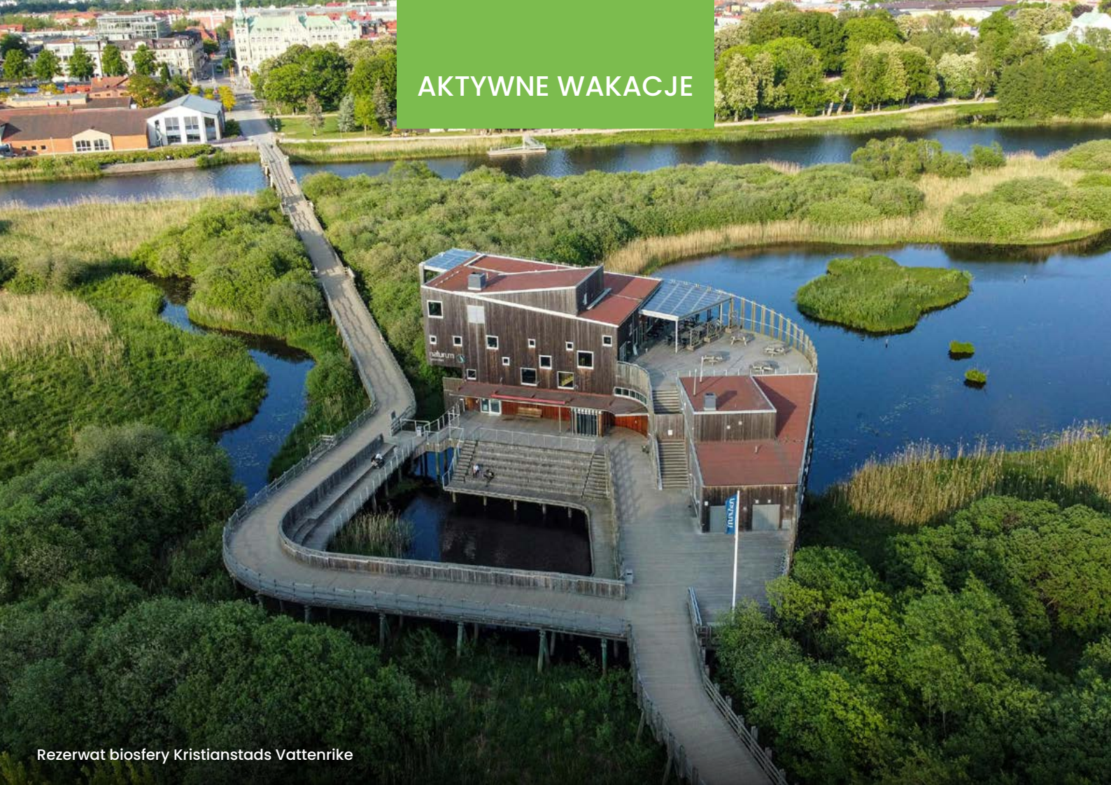
Rezerwat biosfery Kristianstads Vattenrike