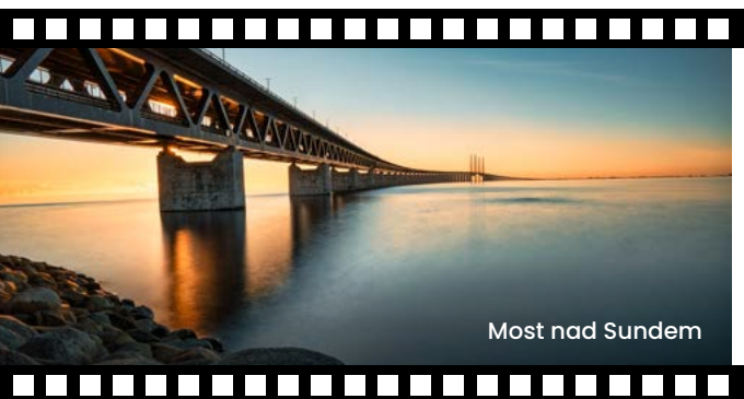
Most nad Sundem