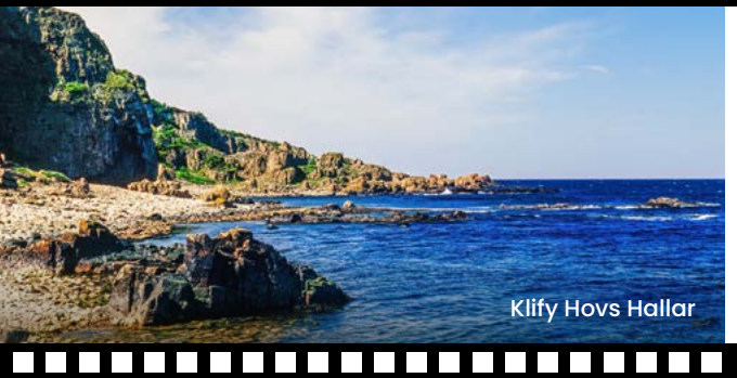
Klify Hovs Hallar