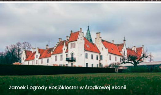
Zamek i ogrody Bosjökloster w środkowej Skanii