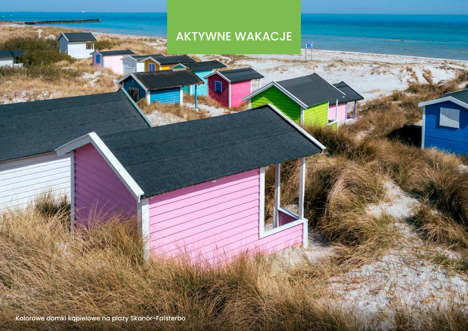
Kolorowe domki kąpielowe na plaży Skanör-Falsterbo