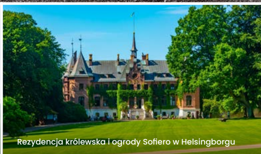
Rezydencja Królewska i ogrody Sofiero w Helsingborgu